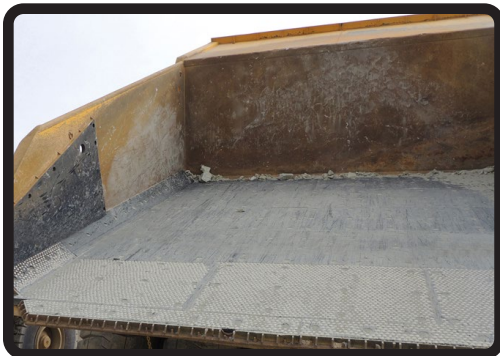
Revestimiento de Tolvas de Camiones – Revestimientos de Descarga

Caucho con Cerámica se puede utilizar en las áreas de impacto en las mallas de harneros y también en las áreas de alto desgaste en las tolvas de camiones para extender la vida útil.