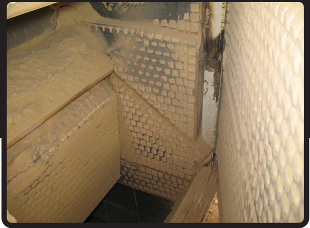
Revestimientos de Cubos Cerámicos aplicada en la Puerta Triple del Alimentador puede soportar condiciones extremas de impacto y abrasión por años.

Mientras que el caucho es más resistente a la abrasión que el acero en la aplicación correcta, la cerámica es más resistente a la abrasión que el caucho. Generalmente cerámica sin caucho no es la solución correcta.