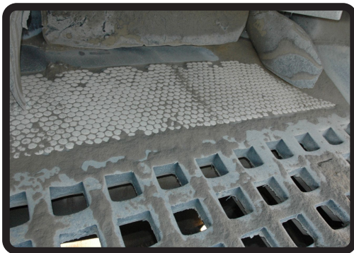
Área de Impacto en las Mallas Clasificadoras de los Harneros

Mientras que el caucho es más resistente a la abrasión que el acero en la aplicación correcta, la cerámica es más resistente a la abrasión que el caucho. Generalmente cerámica sin caucho no es la solución correcta.