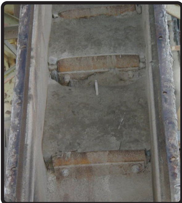
A/R recubrimientos de Acero